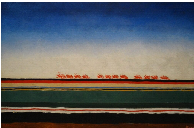
Kazimir Malevič, Rdeča konjenica , 1932, olje na platnu, 91 x 140 cm