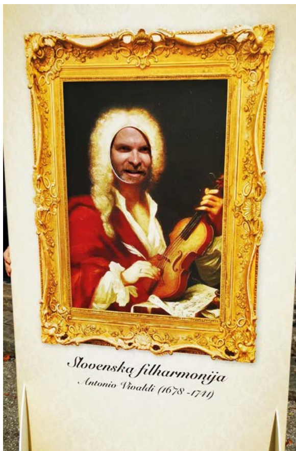
Slovenska filharmonija Antonio Vivaldi (1678 -1741)