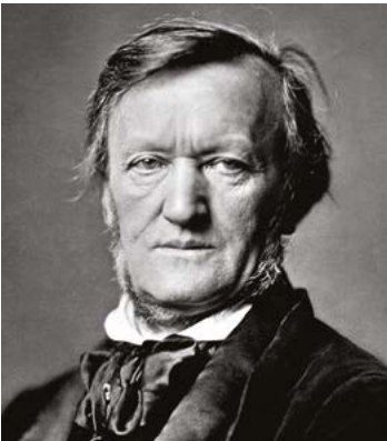
Richard Wagner, okoli leta 1871

Z uvajanjem mreže lajtmotivov je Wagner prekinil stoletno tradicijo opere kot zaporedja različnih in ločenih glasbenih točk ter z značilnimi temami simfoniziral operni orkester; le-te se prepletajo skozi celotno tetralogijo in se, podobno kot v simfoničnem stavku, dopolnjujejo, preobražajo, združujejo, si nasprotujejo itd. Simfonizacija glasbenega tkiva je tako ključno prispevala k samostojnejši vlogi orkestra ter podrobnejši dodelanosti, elastičnosti in polnosti posamičnih orkestrskih skupin. Takšna preobrazba glasbenega tkiva opernega dela je koreninila v Beethovnovem monumentalnem simfoničnem slogu – izhodišču Wagnerjeve glasbene poetike.