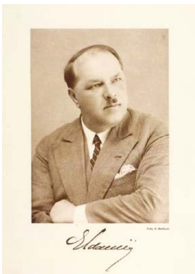
Emil Adamič

Emil Adamič je kot vsestranska glasbena osebnost zapustil globoko sled v slovenskem glasbenem življenju. Skladatelj, dirigent, publicist, kritik in glasbeni učitelj je deloval v širokem časovnem razponu izrazitih družbenih in glasbenih premen: v času avstro-ogrske monarhije, ko se je na Slovenskem krepila identiteta nacionalnega, je ob Gojmirju Kreku in Antonu Lajovcu v reviji Novi akordi zastopal glasbo slovenske moderne, v povojnem času pa je bil priča institucionalne profesionalizacije domačega glasbenega življenja (ustanovitve glasbenega konservatorija) in vstopa mlajše generacije skladateljev (Kogoja, Osterca in Škerjanca) ter novih ustvarjalnih in estetskih tokov.